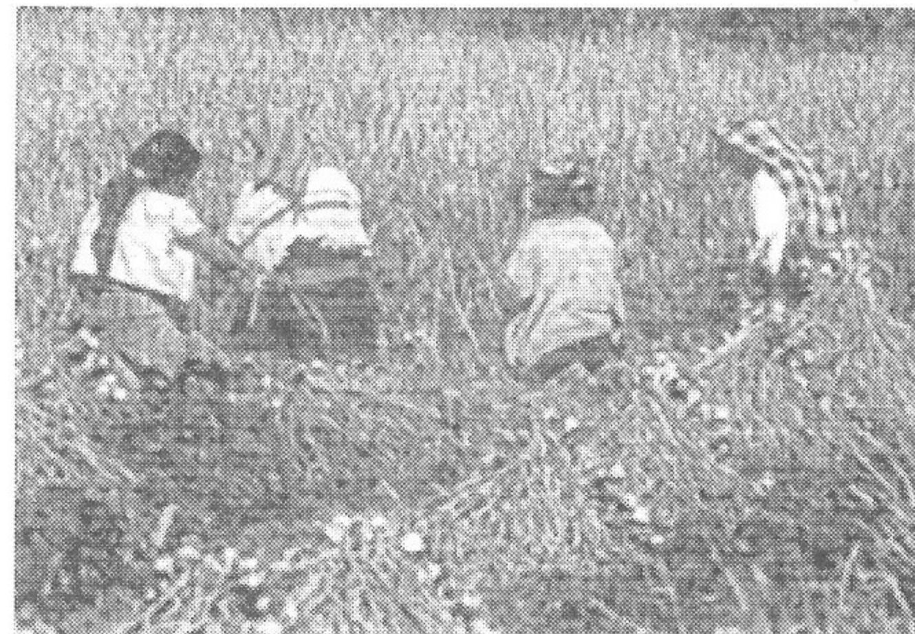
(INMACULADA CASTRO Y MANOLI DURÁN)

El suelo es el recurso más importante de Guatemala, que es básicamente un país agrícola. Hay suelos muy buenos para cualquier tipo de cultivo, mientras que en otros prácticamente no se puede cultivar nada debido a las condiciones del terreno. Los bosques proporcionan madera y otros productos para el consumo y la exportación.